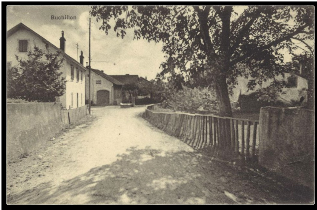
Ci-dessus : Vue vers l'Ouest depuis la Rue du Village

https://buchillon.ch/voyage-photographique-dans-le-temps