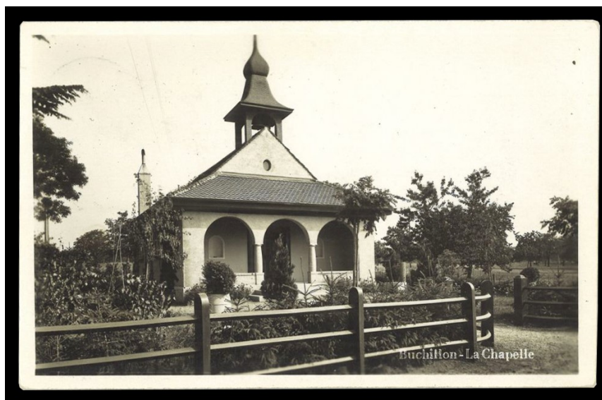
Ci-contre : la Chapelle de Buchillon vers 1930