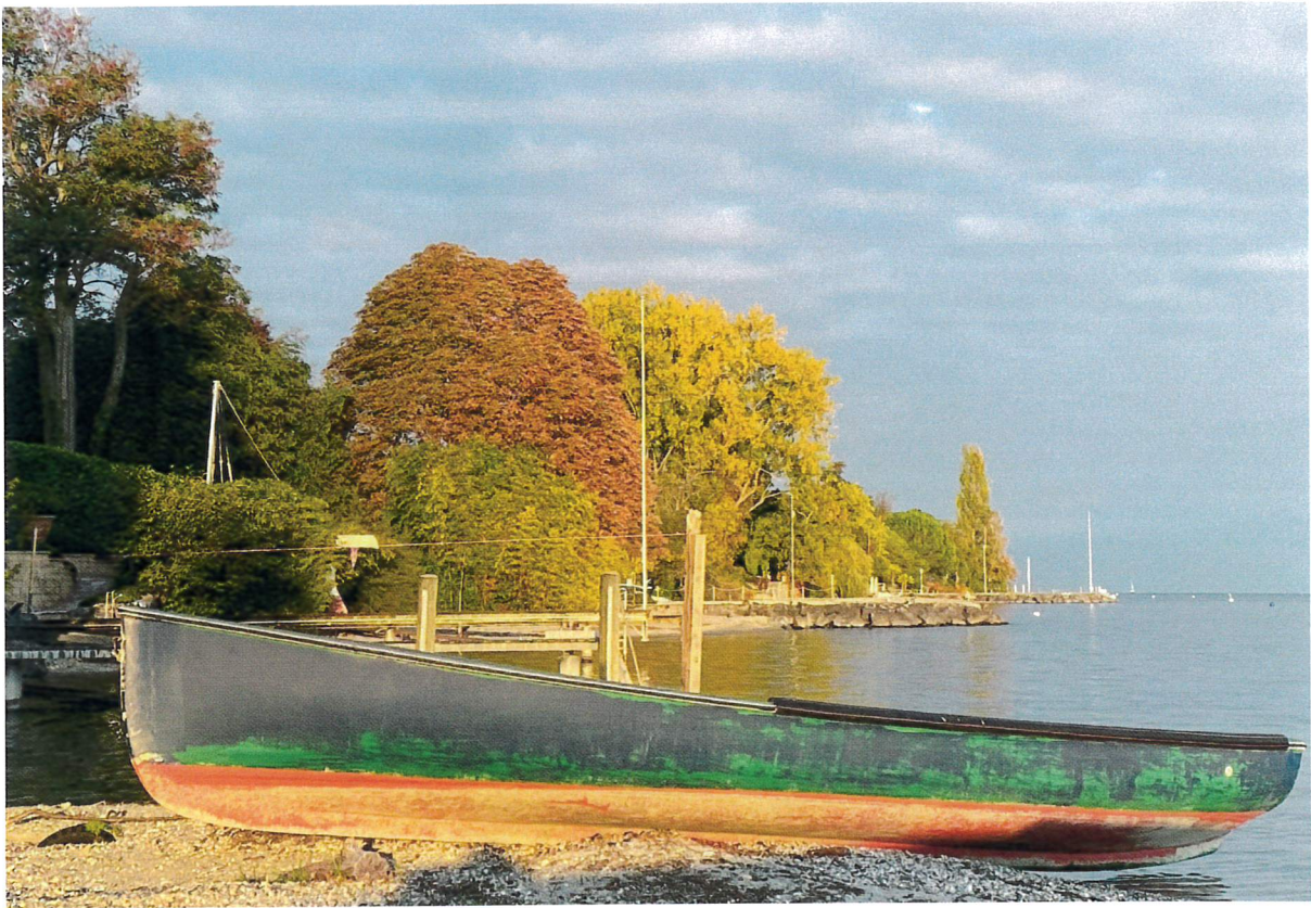
Port des Pêcheurs